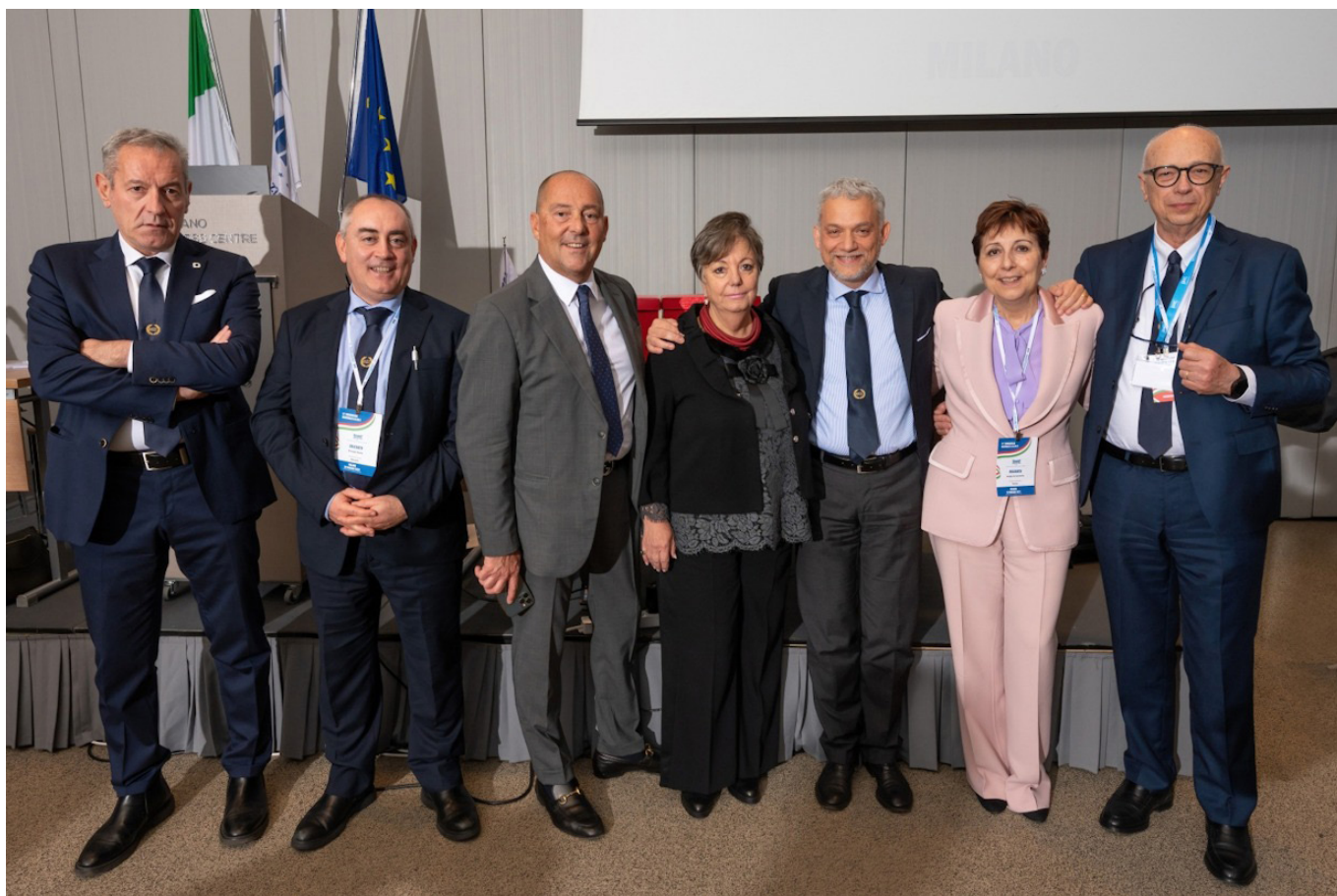
Il nuovo Consiglio