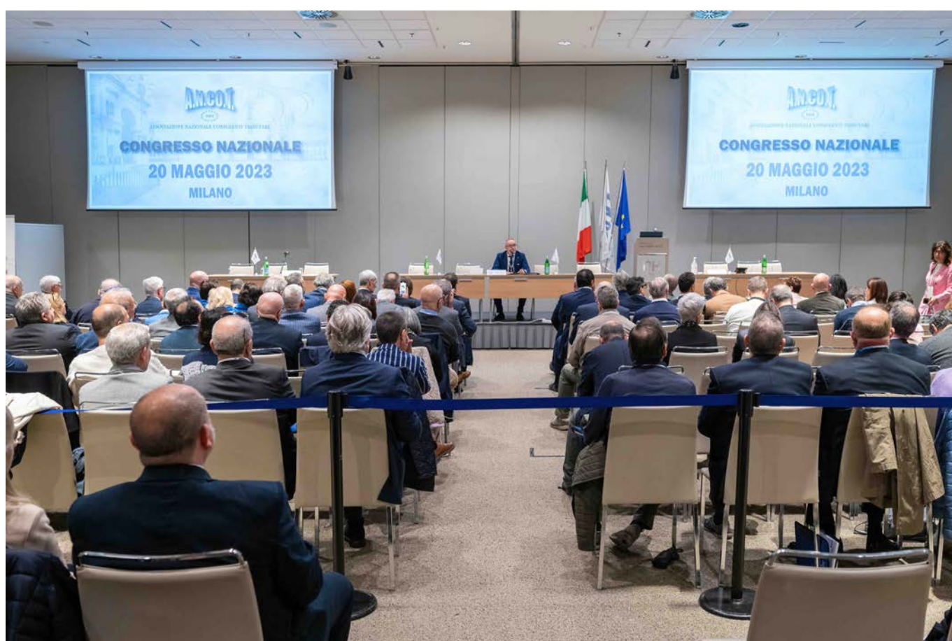
La platea del Congresso di Assago

Il Presidente neoeletto ha ringraziato il Governo “per aver avuto sensibilità ed attenzione nei confronti di uno storico problema dei tributaristi, attraverso l'Ordine del Giorno proposto dal Presidente della Commissione Lavoro della Camera dei Deputati in merito all'estensione ai tributaristi, ex Legge 4/2013, della competenza ad apporre il visto di conformità”.